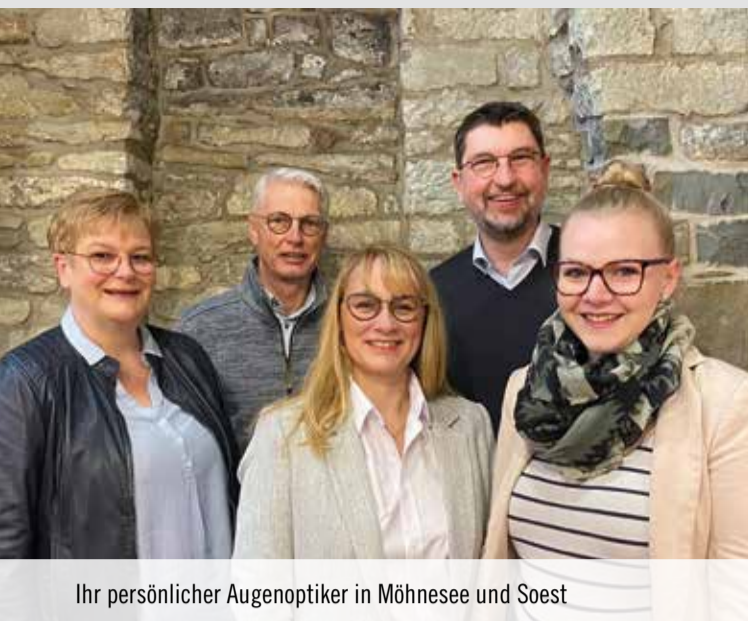
Ihr persönlicher Augenoptiker in Möhnese und Soest